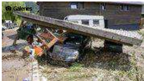
Les inondations de juin 2019 au Val-de-Ruz

Sous un soleil de plomb, les écoliers ont ramassé des morceaux de bois, des chaises, des chaussures et des tas d'autres déchets qui ont fini dans les champs à la suite des intempéries. Muriel Antille Sous un soleil de plomb, les écoliers ont ramassé des morceaux de bois, des chaises, des chaussures et des tas d'autres déchets qui ont fini dans les champs à la suite des intempéries. Muriel Antille Sous un soleil de plomb, les écoliers ont ramassé des morceaux de bois, des chaises, des chaussures et des tas d'autres déchets qui ont fini dans les champs à la suite des intempéries. Muriel Antille Sous un soleil de plomb, les écoliers ont ramassé des morceaux de bois, des chaises, des chaussures et des tas d'autres déchets qui ont fini dans les champs à la suite des intempéries. Muriel Antille