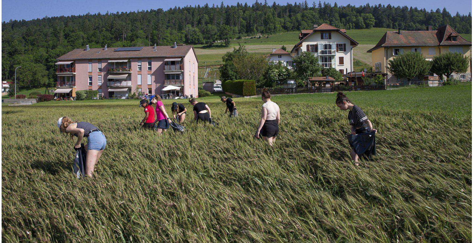
Les élèves un peu plus âgés ont mené des battues dans ce champ d'orge.