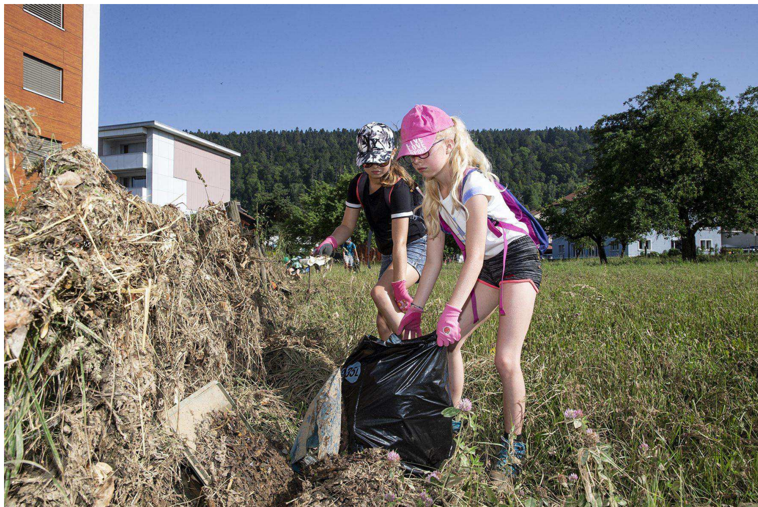
Malgré la canicule, les enfants ont mis du cœur à l'ouvrage.

A lire aussi : Val-de-Ruz: «ArcInfo» s'engage pour une aide sur la durée