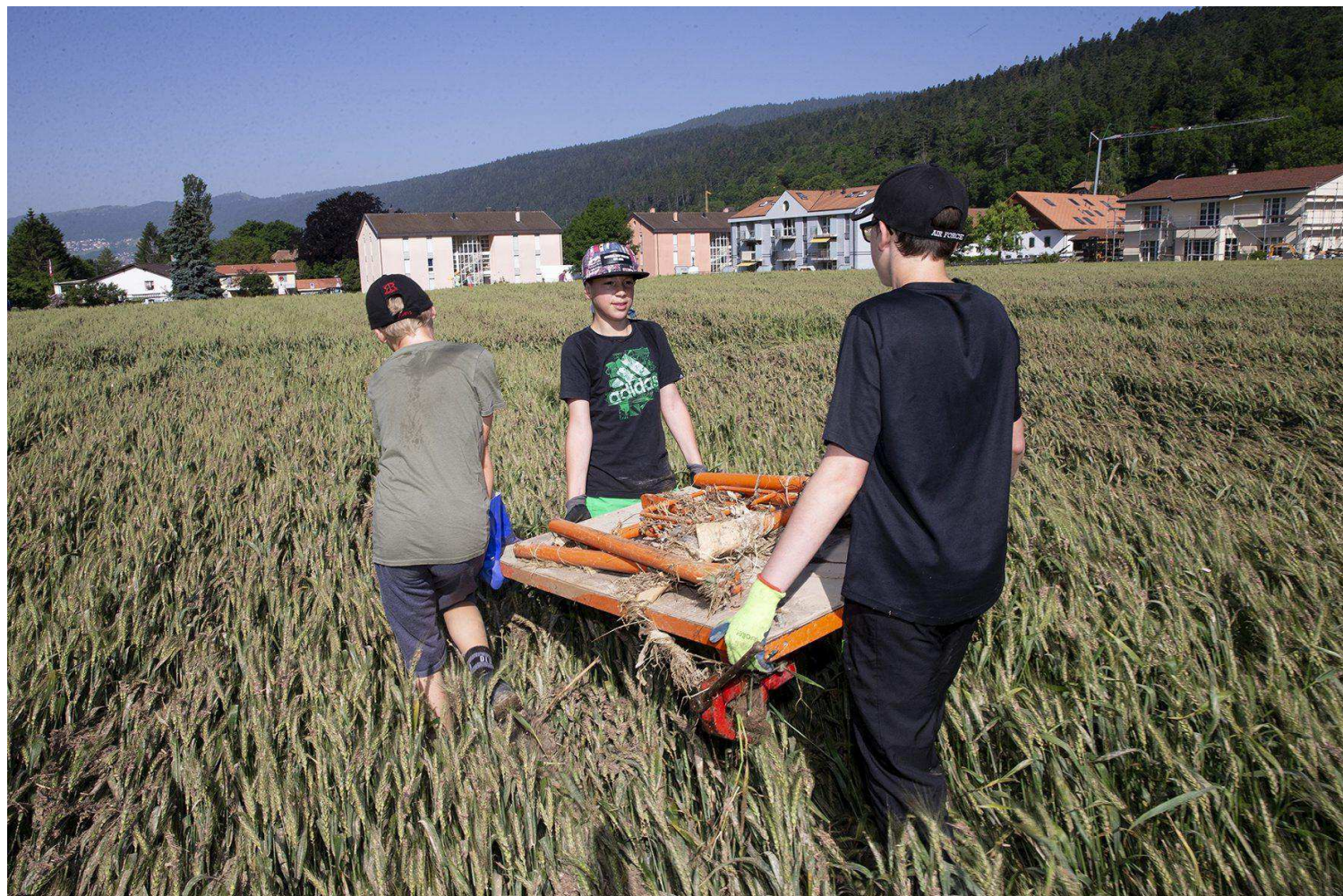
Exit les sacs-poubelles et place à la brouette! Plus simple pour transporter les gros déchets.