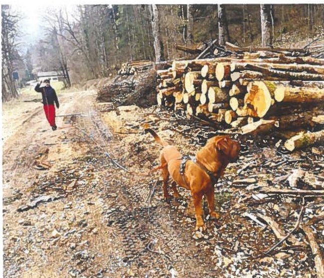
Etane avec Boulette en mode « mantrailing »

L'après-midi, il nous arrive de ressortir pour effectuer l'activité mantrailing qui consiste à ce qu'un(e) élève travaille avec un chien pour retrouver sa-son camarade qui s'est caché(e) dans la forêt. Cette activité ainsi que la gymkhana demandent à l'élève de la concentration, d'être connecté(e) au chien, de se faire respecter en se montrant sûr de soi mais également d'être à l'écoute, de comprendre l'animal et de lui faire confiance; c'est un réel travail d'équipe entre le chien et la jeune.